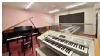
▲スタジオの個人利用は一般60分700円〜。レッスンは大人向けのメニューもあります