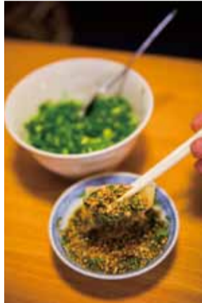
▲餃子は焼・水どちらも一人前20コ700円。前日までに予約をすれば冷凍餃子の持ち帰りも可能