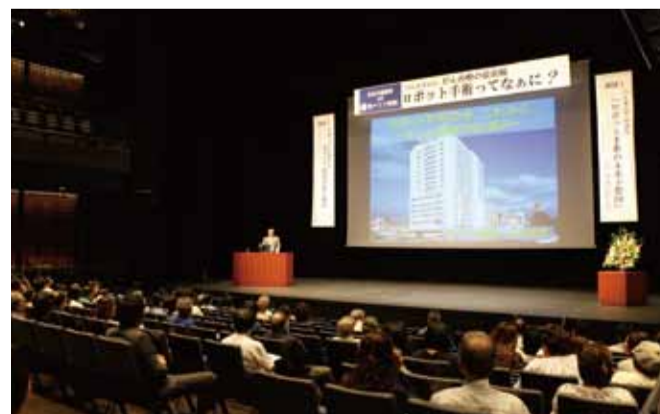
▲6月30日(土)久留米座にて開催された聖マリア病院主催の市民公開講座「がん治療の最前線 ロボット手術ってなんに？」の様子

どの席からもステージに立つ人が見やすいと評判の久留米座。講演・研修会にも最適な劇場空間です。もちろん、音響・映像設備も万全。見学など、お気軽にご相談ください。