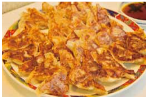
〒久留米市六ツ門町1-9 ☎0942-30-8411 営業18:00~翌2:00(日祝日17:00~24:00) 休不定 席26席 ②なし カード/不可 喫煙/可

昭和22年、大分県別府市の繁華街で創業した、日本でも有数の歴史を誇る餃子専門店『湖月』。その味を受け継ぐこちらのお店では、具・皮・ラー油の全てが手づくりの自家製です。特に透き通るほど薄い皮は、焼き上がるとパリパリの食感なのが大好評。ジューシーな餃子の餡とのバランスが絶妙で、一度食べたら病みつきになるでしょう。県内外からもこの味を求めてファンがやってくるので、なるべくご予約を！