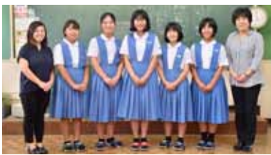
久留米市立良山中学校演劇部のみなさん

演劇部に新1年生が増えて、とても期待値が上がっています。作品は定食屋さんを舞台にしたコメディテイストの物語を予定。本番ではミスをおかさないように心がけます。