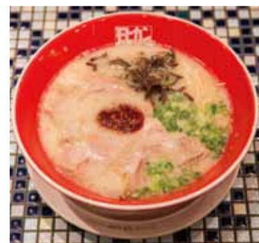
▲極細の麺と極ウマの豚骨スープが見事なハーモニーを奏でる『モヒカンらーめん』。韓国の最高級唐辛子など数種類の調味料で作る秘伝のタレが味に深みを与えています