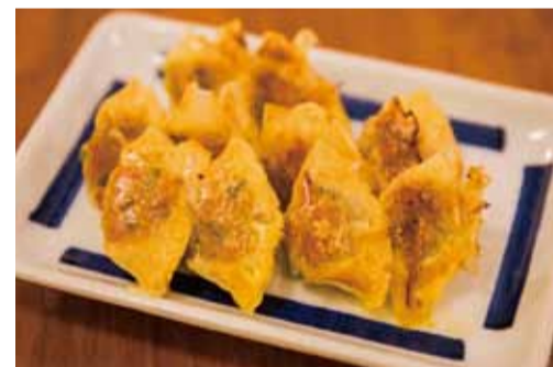
〒久留米市六ツ門町22-36 ☎0942-32-8099 営業18:00~05:23:30 休木曜 席21席 ②なし カード/不可 喫煙/不可