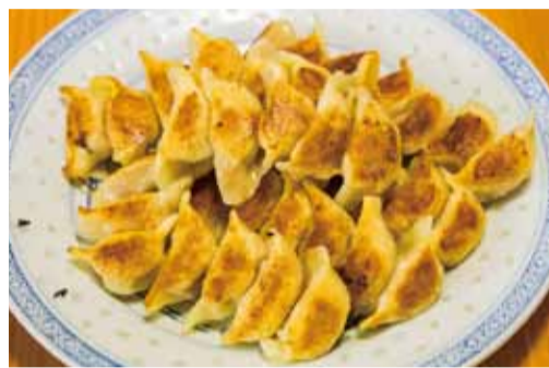
〒久留米市六ツ門町10-34 ☎0942-32-9359 営業14:00~23:00 休日曜 席16席 ②なし カード/不可 喫煙/可

ひと口サイズの餃子は、豚バラ肉と数種類の野菜の旨みを生かしたさっぱり系。ひと晩ねかせた自家製の皮は、焼餃子なら焼き目がパリッ、水餃子ならモチモチ感が特徴です。この店の楽しみは、何と言ってもその食べ方。まず小皿に特製の酢醤油、大量のニラ、スリゴマを入れ、ラー油を加えて混ぜ合わせます。それを餃子のひだの部分ですくってみましょう。ニラとスリゴマの量で味わいが変わるのが面白いハズ。