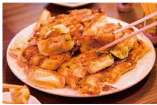
〒久留米市東町26-15 ☎0942-34-2405 営業18:00~05:23:00 休火曜 席60席 ②なし カード/不可 喫煙/可