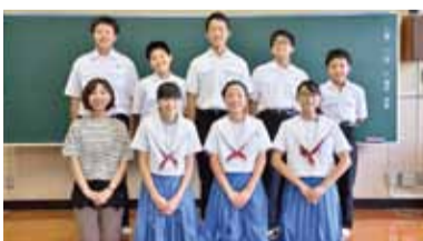
久留米市立諏訪中学校演劇部のみなさん

久留米シティプラザ 久留米座 入場無料※全席自由 久留米市中学校文化連盟演劇部会(明星中学校内) ☎0942-21-9468 ☎0942-21-9469